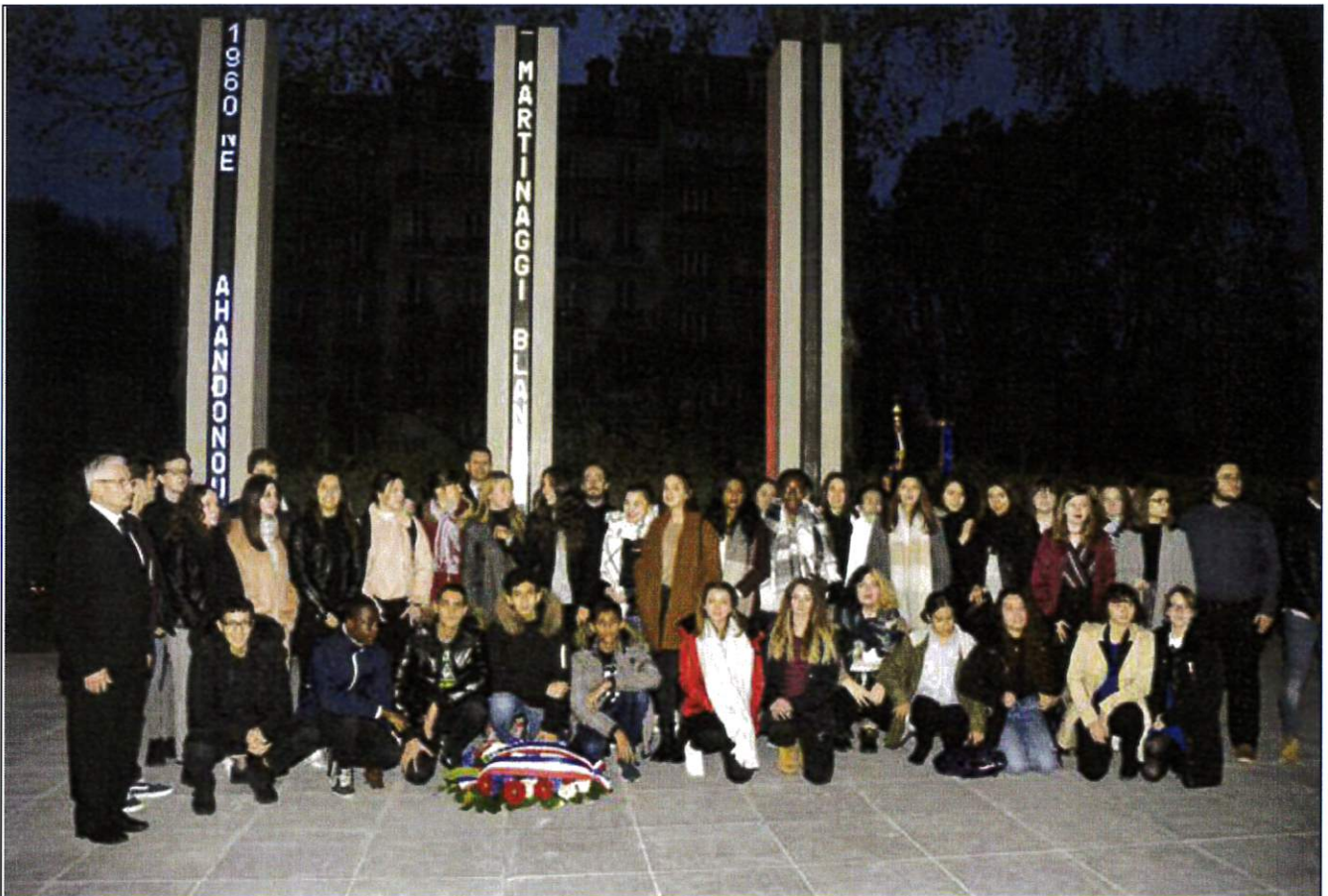
Un groupe de 41 élèves du lycée Marie de Champagne (Troyes) participe à la cérémonie du 5 Décembre 2018.