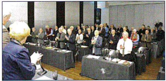
Une partie de la salle.

de la FNACA qui font circuler ces informations dans le but de privilégier le 19 mars. Cette date du 5 Décembre a été choisie par la Fédération et son rôle est de la faire perdurer en s'impliquant au maximum dans cette cérémonie. Dans son département, le 5 Décembre n'est pas interdit mais il n'y a plus d'écoles, plus de militaires, et plus de gendarmes.