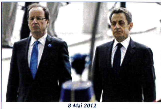
8 Mai 2012

Et le 2 octobre 1981, après l'arrivée de la gauche au pouvoir, les députés effaçaient cette décision présidentielle et votaient une loi inscrivant la « victoire du 8 mai 1945 » comme jour férié dans le code du travail. Avec une nouvelle tradition instituée finalement par le président Mitterrand : Les années d'élections présidentielles ont permis de voir une célébration conjointe par deux présidents de la République, l'un tout juste élu mais en sa qualité de maire de Paris, pas encore investi officiellement, l'autre sur le départ, Jacques Chirac et François Mitterrand en 1995, François Hollande et Nicolas