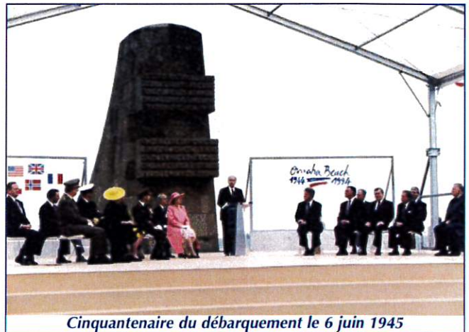
Cinquantenaire du débarquement le 6 juin 1945

Dix ans plus tard, pour le 70 e anniversaire, le 6 juin 2014, les hauts représentants des pays ayant participé à la libération de la France et de l'Europe viennent en Normandie : François Hollande, Barack Obama et Vladimir Poutine.