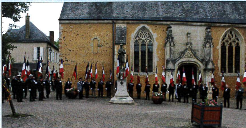
Une haie de porte-drapeaux à la sortie de l'office religieux.

Congrès départemental des ACPG-CATM Dimanche 16 juin 2019 à Tuffé