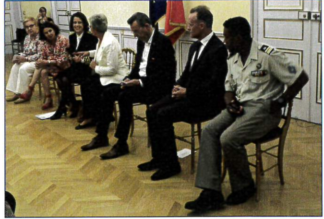
Mme Geneviève Darrieussecq secrétaire d'Etat auprès de la ministre des Armées en visite dans le Puy-de-Dôme s'est arrêtée à Orcines.

Le jeudi 26 juin, Mme Geneviève Darrieussecq, secrétaire d'État auprès de la ministre des Armées chargée des anciens combattants était de passage dans le Puy-de-Dôme, venue visiter le centre où se déroulait à titre d'expérimentation le premier stage du service national universel (SNU). C'est à Orcines proche de Clermont-Ferrand que 137 adolescents viennent de terminer leur séjour.