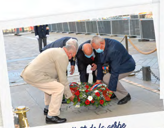
Le dépôt de la gerbe