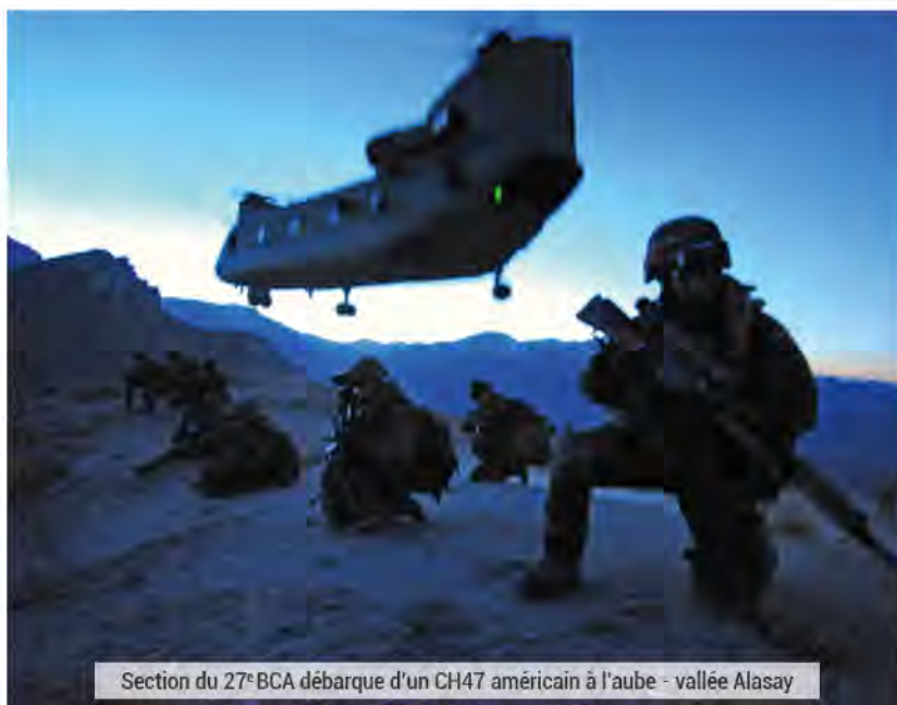
Section du 27 e BCA débarque d'un CH47 américain à l'aube - vallée Alasay

de l'offensive américaine, l'armée de l'air française est présente : des Mirages IV P assurent les premières missions de reconnaissance au-dessus du territoire afghan. Ils sont bientôt rejoints par les appareils du porte-avions Charles de Gaulle, qui croise dans l'océan Indien. Les premières missions d'appui aérien débutent en mars 2002, à peu près au moment où la