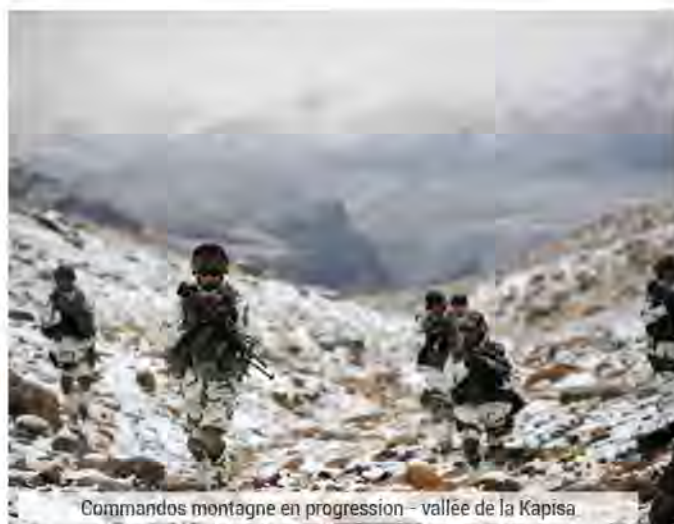
Commandos montagne en progression - vallée de la Kapisa

L'année 2011 a été la plus meurtrière pour les militaires français avec vingt-six soldats tués dans des attentats et accrochages dont cinq morts le 13 juillet dans un attentat suicide en Kapisa, avec en janvier 2012, la mort