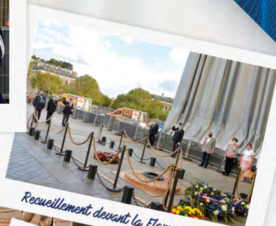
Recueillement devant la Flamme ravivée