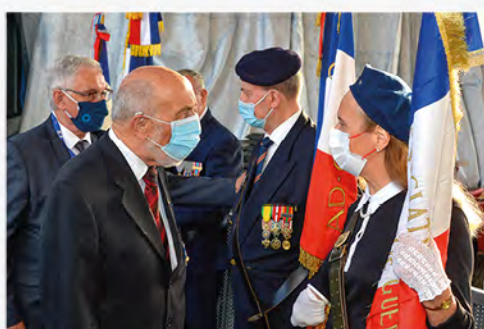
Remerciements de la part du Président