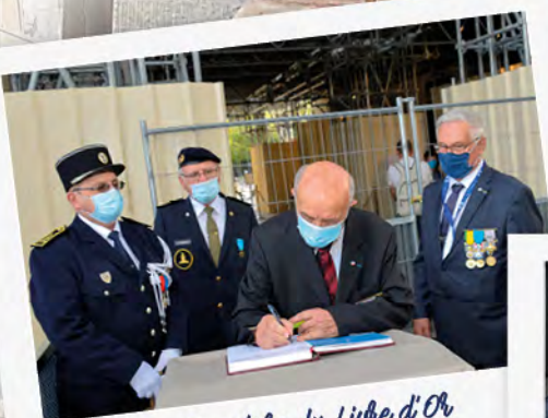
Signature du Livre d'Or