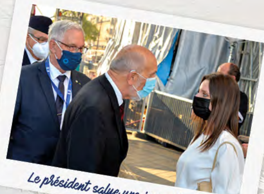
Le président salue une jeune étudiante