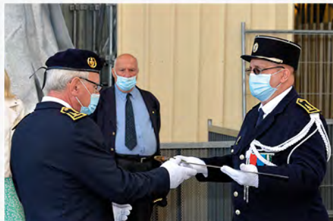
Le glaive nous est confié