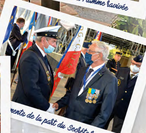
Remerciements de la part du Secrétaire Général