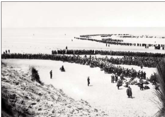
L'application Opération Dynamo est disponible gratuitement sur l'Apple store et Google Play.