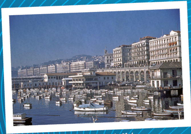
ALGER Le Port de Pêche

Mensuel de la Fédération Nationale des Combattants, Prisonniers de Guerre et Combattants d'Algérie, Tunisie, Maroc