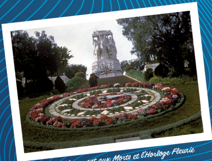
ALGER Monument aux Morts et l'Horloge Fleurie

Alger la Blanche en 1958