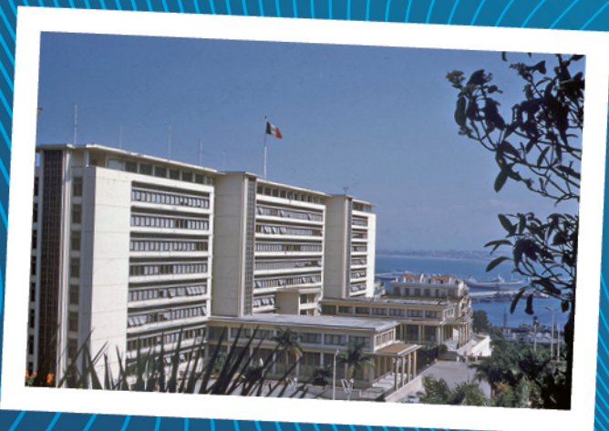
ALGER Le Forum