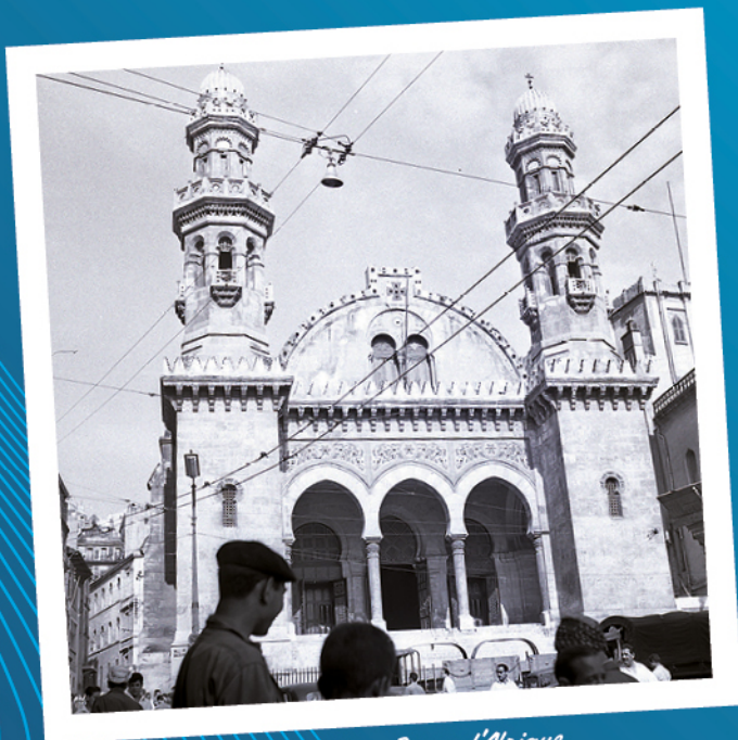
ALGER Notre Dame d'Afrique